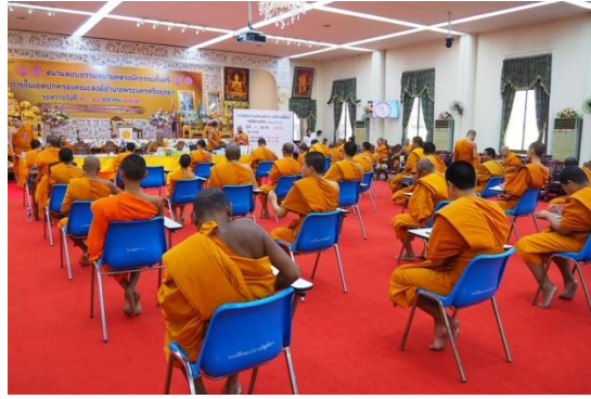
ภาพที่ 1 (ชื่อภาพ)