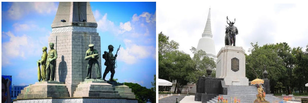
ภาพที่ 5 อนุสาวรีย์ชัยสมรภูมิ และ อนุสรณ์ดอนเจดีย์ชัยชนะแห่งพระนเรศวร