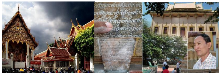
ภาพที่ 3 วัดชัยชนะสงคราม (วัดตึก) กรุงเทพมหานคร และวัดที่พนมเปญ อนุสรณ์ของเจ้าพระยาบดินทรเดชา อันเนื่องด้วยสงครามและสัญลักษณ์แห่งชัยชนะ