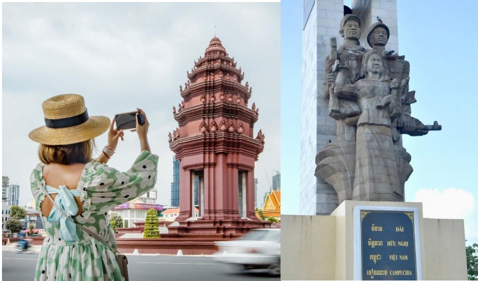
ภาพที่ 7 อนุสาวรีย์เอกราช และอนุสรณ์สถานชัยชนะกลางกรุงเทพมหานคร