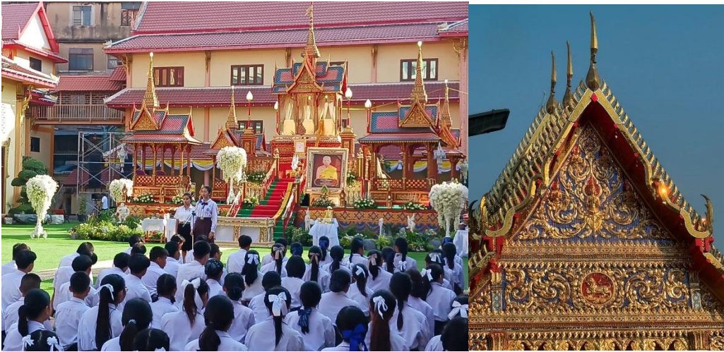
ภาพที่ 2 พิธีพระราชทานเพลิงศพ พระราชวริยະสุนทร (ยีน วรกิจใจ) อดีตเจ้าอาวาสวัดชัยชนะสงคราม (วัดตึก) และสถาปัตยกรรมที่สะท้อนความเกี่ยวเนื่องเป็นรูปสิงห์ (เสนีย์) ที่หน้าบ้านอุโบสถวัด ที่มา: ภาพผู้เขียน