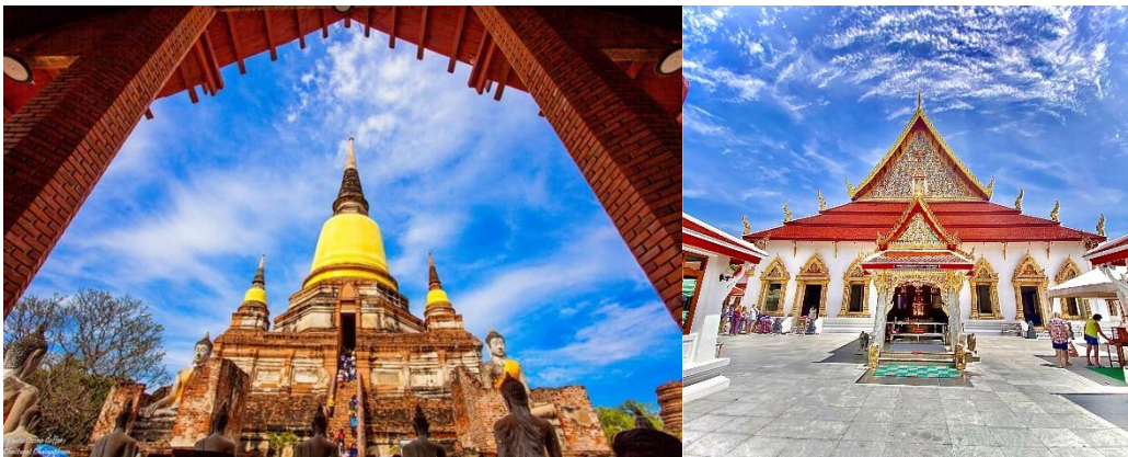
ภาพที่ 4 วัดใหญ่ชัยมงคล อยุธยา วัดชนะสงคราม กรุงเทพมหานคร อนุสรณ์สถานแห่งชัยชนะที่เนื่องด้วยศาสนสถานในพระพุทธศาสนา

ดังนั้นในเหตุการณ์ที่เนื่องด้วยเจ้าพระยาบดินทรเดชา จึงเนื่องด้วยความสำคัญดังกล่าว และก่อให้เกิดแนวคิดเรื่องอนุสรณ์สถานกับความเชื่อที่เนื่องด้วยสงคราม ดังนั้นวัดชัยชนะสงครามที่ผู้เขียนเดินทางไปเฝ้าศพ จึงเนื่องด้วยเขมรแต่เป็นการสร้างเพื่อเป็นอนุสรณ์สถาน คติของการสร้างวัดจึงเป็นคติหนึ่งของสังคมไทยหรือบรรพชนของสยามกับการสร้างเพื่อเป็นอนุสรณ์ รวมทั้งคติของการสร้างวัดนัยหนึ่งเพื่อเป็นการไถ่ถอนสำนึกบาปบางประการ อีกนัยหนึ่งเป็นการแสดงออกที่เรียกว่าพลังแห่งศรัทธาในพระพุทธศาสนา และที่สำคัญ อาจเป็นคตินิยมของชนชั้นปกครองที่มองว่าการสร้างวัดคือการแสดง “ทาน” ตามหลักของผู้บำนาในข้อ ทศพิธราชธรรม จึงกลายเป็นคตินิยมที่ว่าสร้างวัดให้ลูกวิ่งเล่น หรือคิดว่าด้วยการสร้างวัดเพื่อเอาใจชนชั้นนำ ดังคติการสร้างวัดในช่วงสมัยรัชกาลที่ 2 และ รัชกาลที่ 3 กรณีของวัดชัยชนะสงคราม รวมทั้งวัดอื่น ๆ อีกจำนวนมาก แต่ที่ยกมาเป็นคติของการสร้างวัดเพื่อเป็นอนุสรณ์สถานแห่งตระกูลหรือสายตระกูลดังปรากฏในบริบทของสังคมไทย