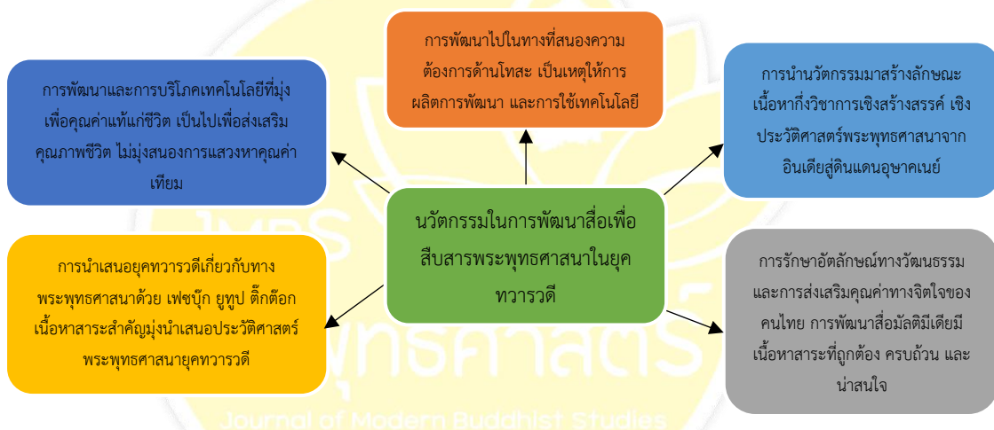
ภาพที่ 2 องค์ความรู้ที่ได้จากการวิจัย

องค์ความรู้ที่ได้จากการวิจัย “นวัตกรรมในการพัฒนาสื่อเพื่อสืบสารพระพุทธศาสนาในยุคทวารวดี” มีรายละเอียดตามแผนภาพดังนี้